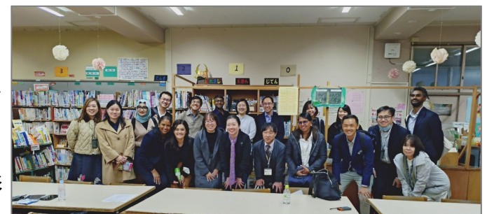
最後の 記念撮影 →