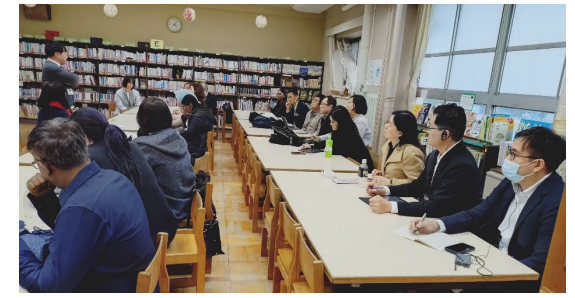
↑交流会・質疑応答