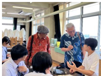
←美術室で生徒に質問をするインドネシアの先生