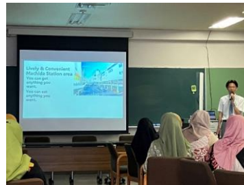
↑町田市や小川高等学校の紹介