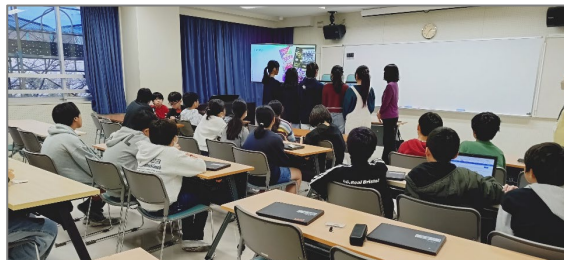
都側児童の発表の様子 ↑ カザフスタン児童の発表を聞く様子 ↓