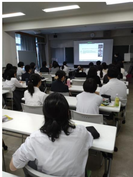
↑交流の流れについてSOTAからの説明を聞く片倉高校の生徒

シンガポール共和国 School of the Arts, Singapore (SOTA) Secondary 3 約20名