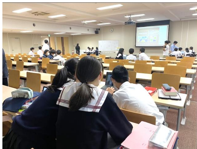
↑10グループに分かれ、各グループは十分に距離を取って交流を行った。