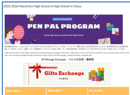
↑ メッセージや写真の交換

アメリカ合衆国 テキサス州 MacArthur High School 1～3年生 日本語クラス 50名