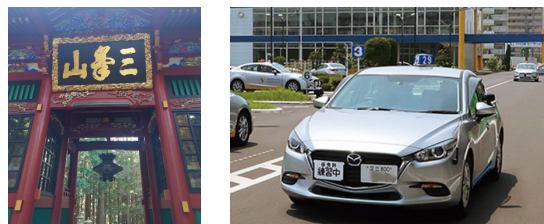
↑ 都側生徒の投稿（休日の過ごし方）