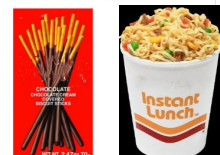
↑ アメリカ側のテーマの「日常生活にある日本のもの」