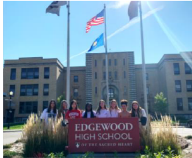
↑ Edgewood High School の生徒