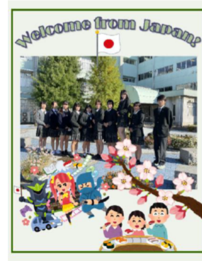
↑ 自己紹介・学校紹介カード