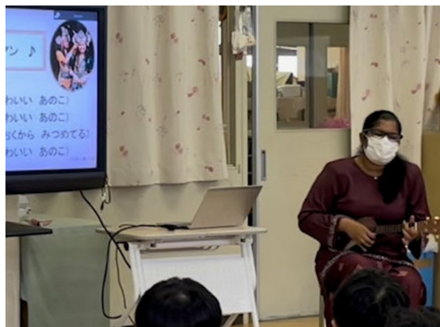
↑マレーシアの代表曲「ラサ・サヤン」の弾き語り