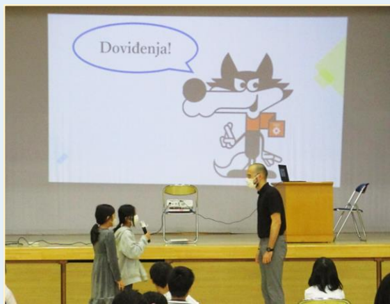
↑ 留学生による講演の様子 ↑