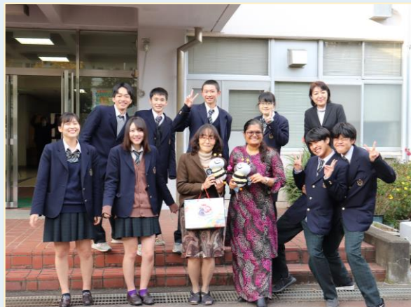
↑ 大使館の関係者による学校訪問の様子 ↑