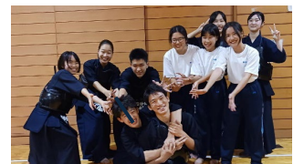
お二人の指導のもと成長を 続ける生徒のみなさま

○ お二人の指導者がいることで、それぞれ違う視点からアドバイスをいただける環境があります。いただいたアドバイスのおかげで剣道に対する視点や考え方が変わり、自分自身も成長できたと思います。先生方や先輩たちは、剣道勉強・生活面などいろいろな面で支えてくださるので本当にありがたいです。