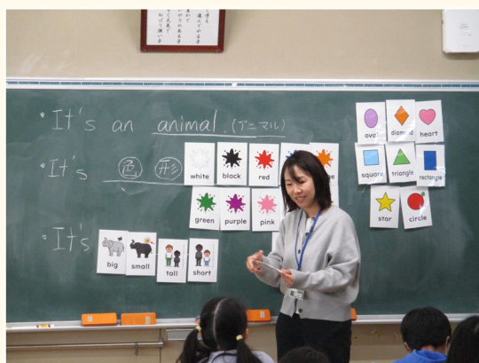
▲絵カードを用いて指導する様子