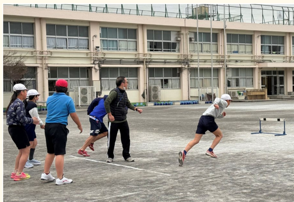
▲ハードル走を指導する様子