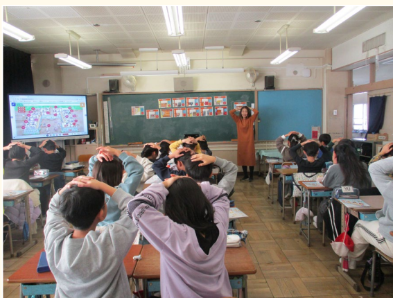
▲ゲームを通して英語に親しむ指導の様子