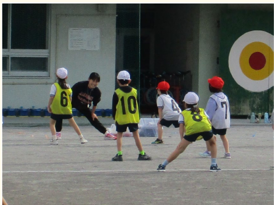
▲ボール投げ運動前の準備体操の様子