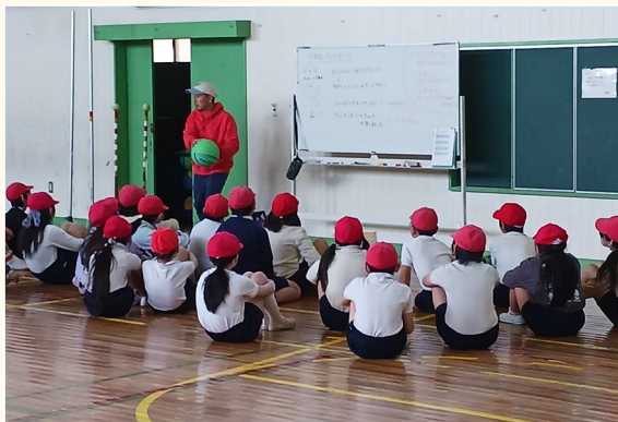
▲ボールの投げ方を説明する様子