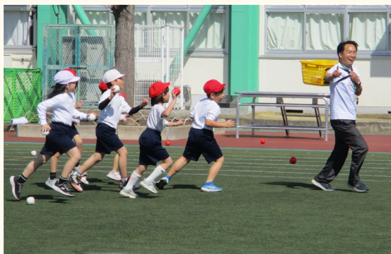
▲走る講師のカゴを目掛けて玉を投げる「追いかけっこ玉入れ」の様子