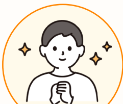
体育で活躍中の Aさんの場合

学校を掛け持ちしていただくことや、年間を通じて複数の学校で勤務していただくことも可能です！