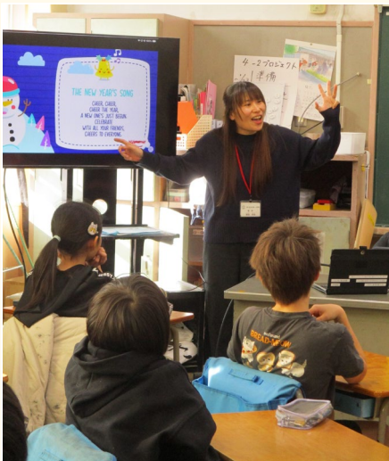
◀英語の歌を指導する様子