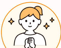
外国語活動で活躍中の Aさんの場合

客室乗務員を退職しました！ 国際線にも搭乗し、英語の活用経験が豊富です。 平日月曜日と金曜日の週2回活動しています。