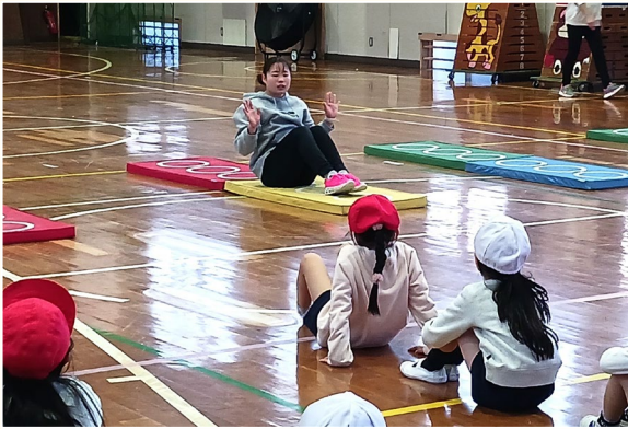
▲マット運動でお手本を見せる様子